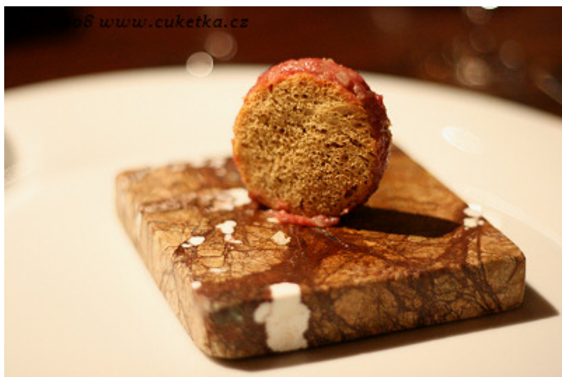
Plochý křupavý disk plněný tataráčkem. TAKTO by měly vypadat křupky k televizi a k pivu!