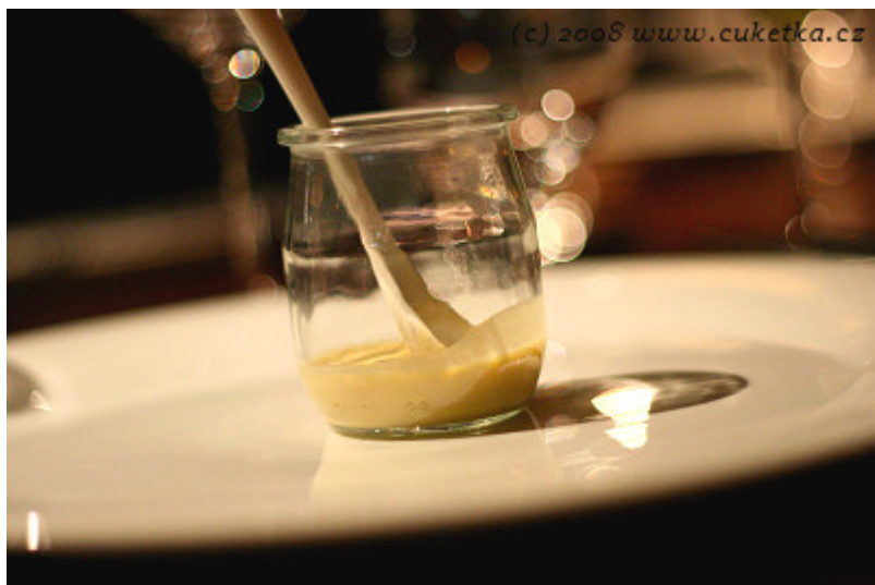
Pěna z foie gras v malé zavařovačce z lisovaného skla. Velikost porce 0,04 l je záměrná provokace! Prdelkovitá hebkost.