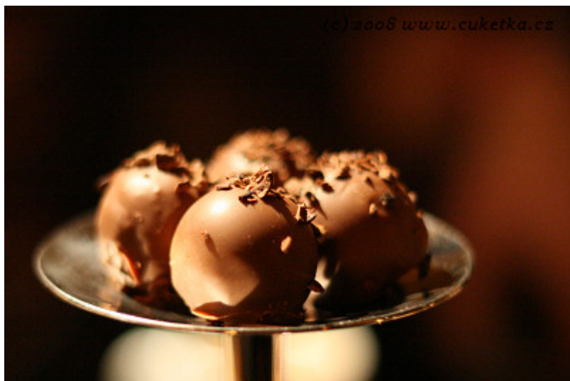
Petit fours – domácí pralinky (2 druhy), mini cheesecake a malý dortík z plňkou z aromatické fazolky.