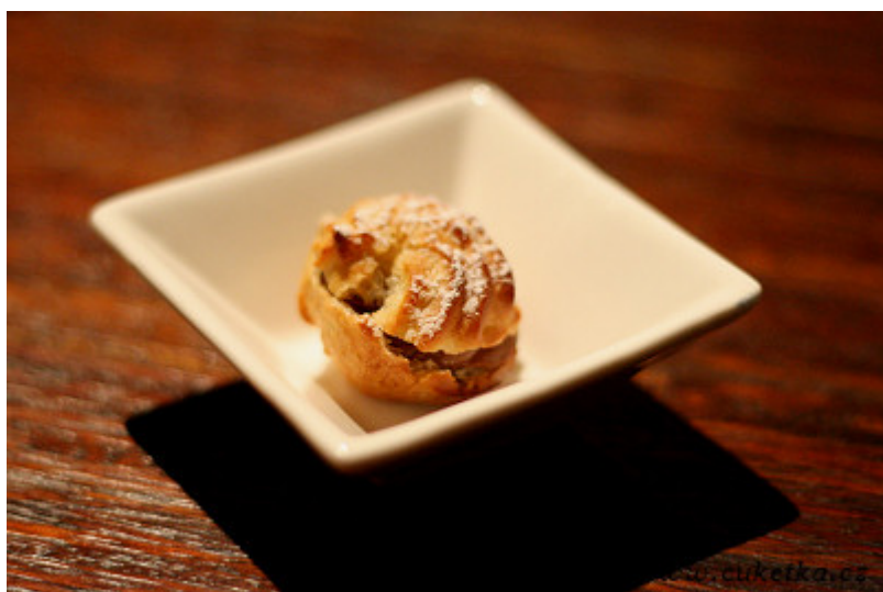
To je on!