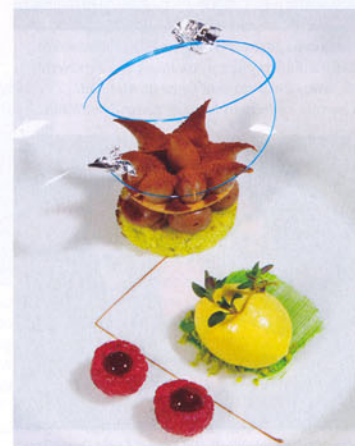
Ganache aux Papouasie 35,7% chocolat, vanilková zmrzlina

poctivě české kuchařské tradice. Bylo jich osm a k tomu čtyři rozverně pozdravy kuchařů ve formě amuse-bouche, tenhle soubor dokázal dokonale předvést to, proč byla kuchyně našich předků považována za jednu z těch lepších. Ještě však přece jen pár slov o dezertu. Tvarohové knedlíky s jahodami, ne větší dvoukoruny, křehoučké a díky čerstvému ovoci neskonalé svěží, báječně uzavřely plejádu chutí nehledaného gurmetského prožitku.