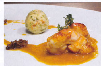
Telecí zbrlík na čerstvých houbách s bylinkami, houskový knedlík